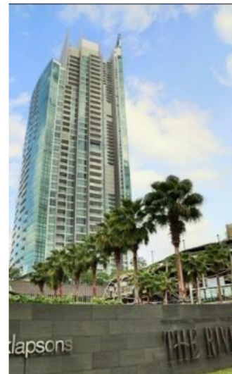
ภาพที่ 1-2 สภาพโครงการในปัจจุบัน